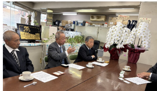
組合員の現状を伝える薄井委員長(中央)