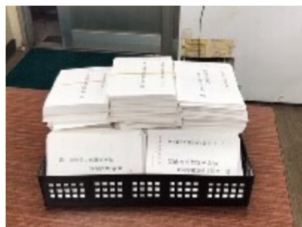
今回は1,511枚集まりました

と回答を頂きました。また、毎年皆様には直筆のハガキ要請にご協力頂いており、今回は1511枚のハガキを頂くことが出来ました。このハガキ要請は組合員が直接苦しい実情を伝え予算要求を訴える非常に重要な取り組みです。お忙しい中、ご協力ありがとうございました。