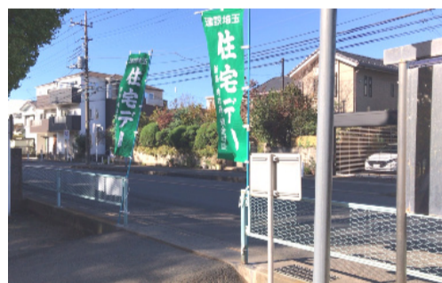
のぼり旗で組合をアピール

内容は、職人による包丁研ぎの無料サービス(一人につき2本まで)と住宅に関する相談受付で、多くの地元住民の方々が訪れました。研いだ