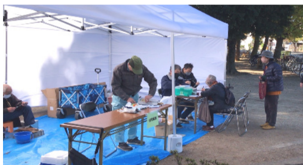
無料で包丁研ぎの住民サービス

11月23日(土)、川口市前田東公園(事務所隣の公園)にて「建設埼玉鳩ヶ谷地区本部住宅デー」を開催しました。