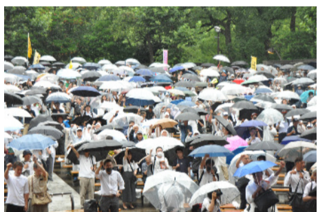
雨の中、約2,000人が声を上げました

全建総連の中西委員長は、今回の参議院本会議で採択された「建設労働者の雇用改善、担い手確保・育成に関する請願」に触れ、全国の仲間が一丸となって取り組んだ100万人国会請願署名の成果と総