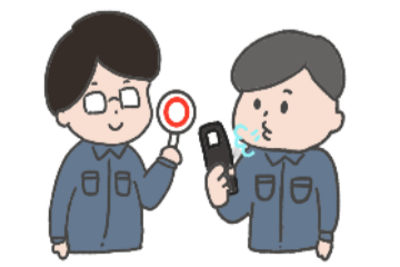
アルコール検知器が必要に